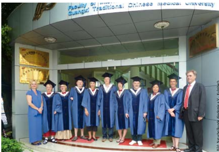
Erfolgreiche Absolventen des Master-Studiengangs TCM an der Universität Guangxi.

gemeinsam mit europäischen Behörden neue TCM-Fahrpläne für die EU aufzustellen. Auf dieser Konferenz ging es um eine Aufwertung und Standardisierung der TCM, nicht nur hinsichtlich der vereinfachten Registrierung für chinesische traditionelle Heilmittel, sondern auch für den Hochschulbereich, also der TCM-Qualifizierung. Dieser Prozess wird in naher Zukunft wohl auf die Etablierung der TCM in Europa als offizielles Studienfach nach einem einheitlich geregelten Studienplan hinauslaufen. In diesem Zusammenhang sind natürlich international anerkannte Studienabschlüsse anzustreben, etwa Bachelor und Master.